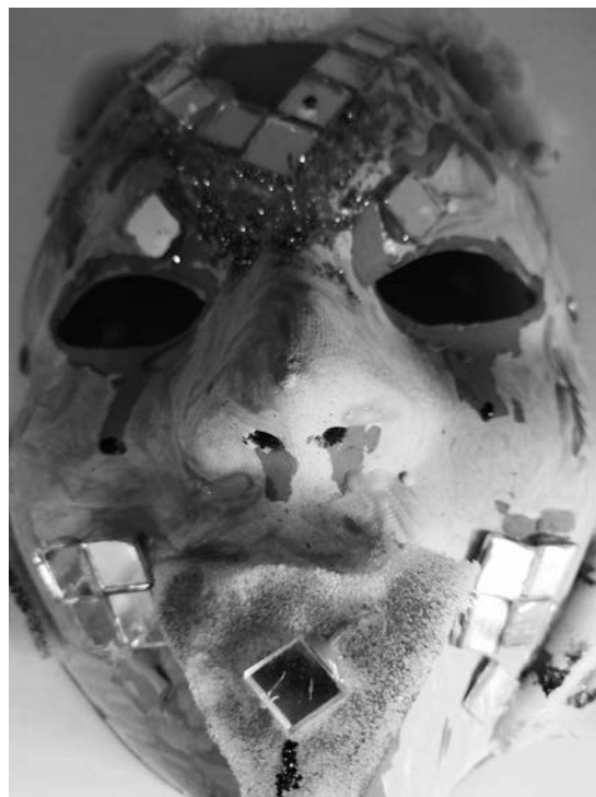
Foto eines «Grindes», welcher am Güdismontag in der Schule entstanden ist.

Die Kinder der 5./6. Klassen fuhren in Begleitung einiger Lehrpersonen nach Luzern und erlebten den Vormittag des Güdismontags in der Altstadt. Dabei standen Auftritte ausgewählter Guggenmusigen auf dem Programm.