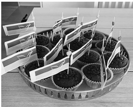
Muffins for Ukraine!

Kinder sind in jedem Krieg oder bewaffneten Konflikt immer die schwächsten, unschuldigsten Opfer. Wenn Kinder anderen Kindern helfen, so wie unsere Klasse 3./4. B in diesem Fall, ist dies bewundernswert und verdient unseren grössten Respekt.