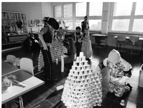
Fröhliches Becherbasteln in lustigen Verkleidungen.

Die Kinder des Kindergartens und der 1. - 4. Klasse konnten zwei Ateliers besuchen und dort beispielsweise Masken («Grinde») basteln, sich in der Turnhalle vergnügen, sich schminken oder mit Bechern grosse Bauwerke erstellen.