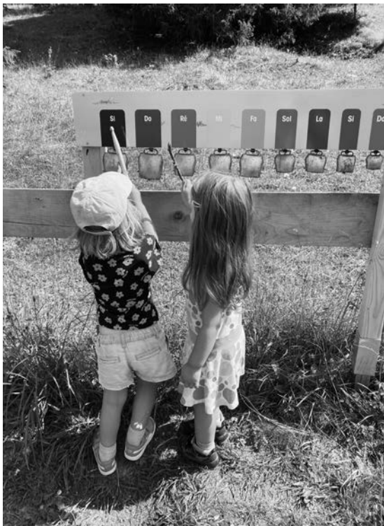
Der neue Kuhglockenposten ist bei Gross und Klein beliebt

Mutterkuh zu reiten und beim Posten «Abfall auf der Kuhweide» wird sich schnell herausstellen, wer als Aludosen-Schützenkönigin bzw. -könig in die Geschichte ein-geht.