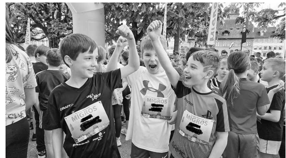
Motivations-Ritual vor dem Start der 3./4. Klassen.

Unsere Viertklässler konnten den 20. Rang in ihrer Kategorie erreichen, die Drittklässler schafften es auf Rang 14 und die 5./6. Klässler platzierten sich sogar auf dem 10. Rang in ihrer Altersstufe.