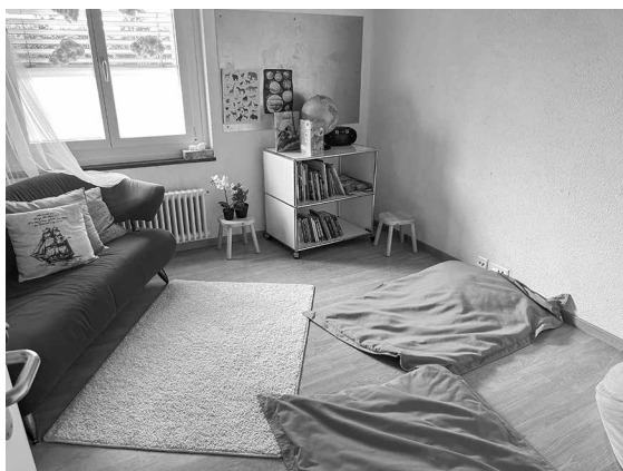
Das neu eingerichtete Ruhezimmer.

Die Infrastruktur wird nun optimal ausgenutzt und wirkt ansprechend, hell und gemütlich. Von der Kapazität her stösst sie an den Nachmittagen, insbesondere dienstags und donnerstags, an ihre Grenzen. An Mittagessen ist am Montag, Dienstag und Donnerstag in diesen Räumlichkeiten schon längst nicht mehr zu denken, weshalb die grossen Gruppen an diesen Tagen im Foyer des Schulhauses Höfli essen.