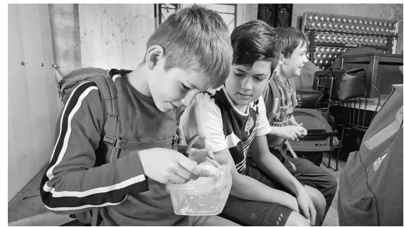
Die Kinder durften Bienenwaben anschauen.