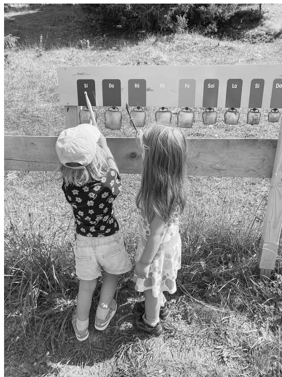
Der neue Kuhglockenposten ist bei Gross und Klein beliebt

11 Posten. Zusammen mit den Wandernenden entdecken die Geschwister eine Menge rund um das Thema Mutterkühe und ihre Kälber. Auf spielerische Art und Weise geben sie ihr Wissen speziell an die jungen Besuchenden des Erlebnispfads weiter. Beim Kuh-Kalb-Stier Polo gilt es beispielsweise herauszufinden, was Mutterkühe fressen. Beim Thema Rassenvielfalt lädt ein «Steckenkalb» ein, zur richtigen Mutterkuh zu reiten und beim Posten «Abfall auf der Kuhweide» wird sich schnell herausstellen, wer als Aludosen-Schützenkönigin bzw. -könig in die Geschichte einget.