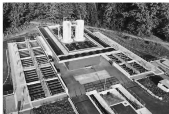
Anlage der vierten Reinigungsstufe zur Elimination von Mikroverunreinigungen