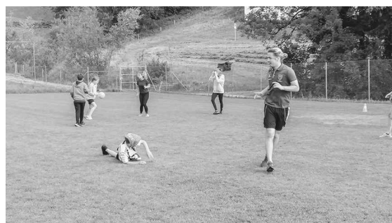
Spass und Action sind im Hammerball garantiert!

Ich bedanke mich an dieser Stelle herzlich bei der Schülergruppe aus der 5. Klasse, welche das Spiel souverän organisiert und geleitet hat.