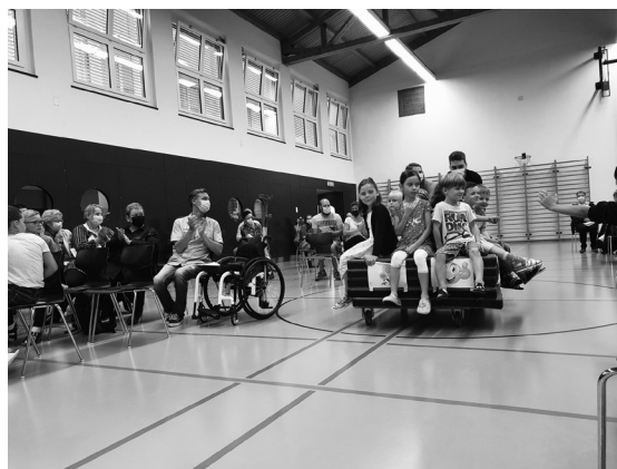
«Grosser Bahnhof» für unsere Jüngsten: Die Kinder der 1. Klasse werden auf dem Mattenwagen in die Turnhalle gefahren.

So lautet das Jahresmotto der Schule Meierskappel für das neue Schuljahr 21/22. Am Montagmorgen des 16. August begrüßten wir unsere Schülerinnen und Schüler nach sechs Wochen Sommerferien wieder zurück an der Schule. Speziell hiessen wir die Kinder der 1. Klasse willkommen. Für die Kindergartenkinder startete der Unterricht am Nachmittag.