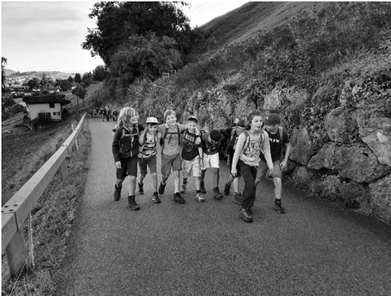
Ausgelassene Wanderstimmung bei diesen Buben der 3./4. Klasse.

Es war sehr anstrengend. Nach zwei Stunden waren wir an der Grillstelle am Waldrand. Es war sehr schön, weil die Sonne schien. Wir assen ein feines «Zmittag», dann spielten wir im Wald. Unser Teamname war Bratwurstteam. Wir hatten richtig coole Waffen gebastelt und waren auf dem Kriegspfad auf dem Weg zur anderen Gruppe. Wir wollten gerade loslegen. Da kam eine Lehrperson und wir mussten zusammenpacken. Wir wanderten etwa noch eine halbe Stunde und dann fuhren wir mit dem reservierten Bus ein Stück. Dann stiegen wir um und fuhren nach Meierskappel Dorfplatz. Es war eine anstrengende aber eine schöne Herbstwanderung.