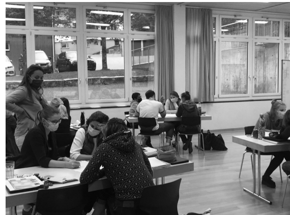
Standortbestimmung zum altersdurchmischten Lernen. Was gelingt bereits gut? Welche Stolpersteine gilt es noch aus dem Weg zu räumen?

In diesem Bereich arbeitet die Schule mit der pädagogischen Hochschule Luzern (PHLU) zusammen. Im aktuellen Schuljahr wird eine Standortbestimmung durchgeführt, auf deren Basis bis 2023 das adL-Konzept der Schule aktualisiert werden kann.